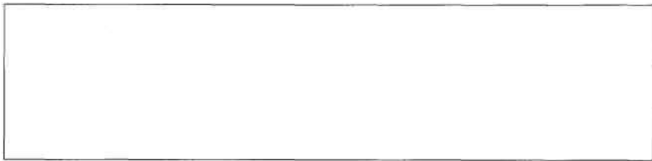
Схема размещения объекта по отношению к улично-дорожной сети

Руководитель образовательного учреждения